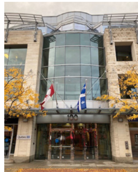
Édifice où est situé l'actuel Bureau du Québec à Ottawa, sur la rue Murray, dans le Marché By.

Le Bureau du Québec à Ottawa a été fermé en avril 2015. Le gouvernement du Québec a annoncé sa réouverture le 17 septembre 2019. La présence du Québec à Ottawa est aujourd'hui plus forte que jamais, le mandat du BQO incluant désormais la promotion du Québec et de ses priorités économiques.