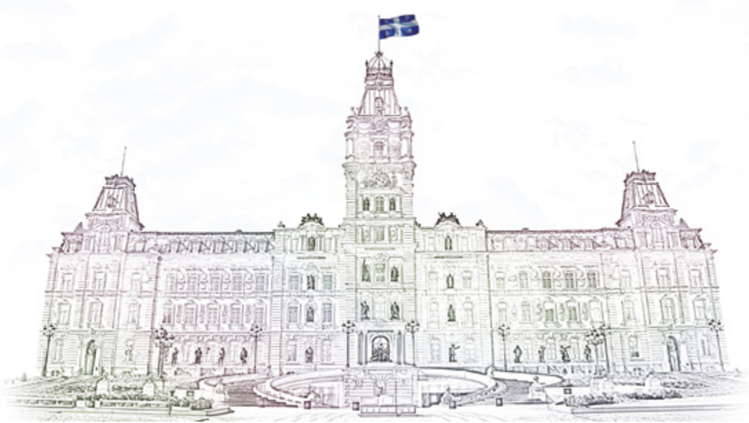
Murale ornant l'actuel Bureau du Québec à Ottawa qui représente l'hôtel du Parlement abritant l'Assemblée nationale à Québec.