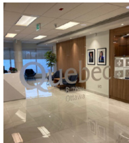
Réception de l'actuel Bureau du Québec à Ottawa.